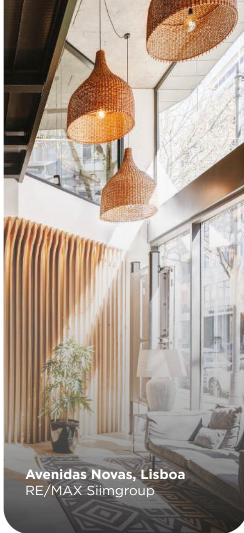
Avenidas Novas, Lisboa RE/MAX Siimgroup