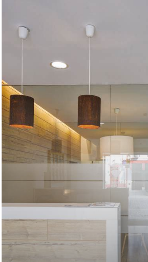
Santo Estêvão, Benavente RE/MAX Siimgroup Countryside