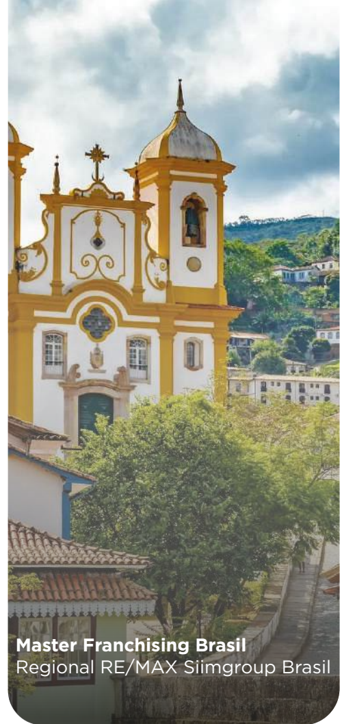
Master Franchising Brasil Regional RE/MAX Siimgroup Brasil