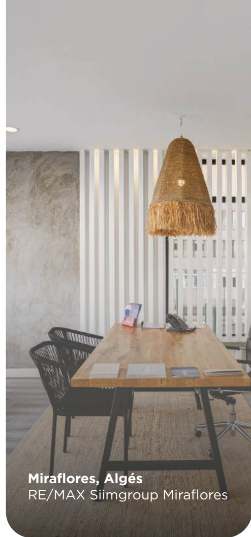
Miraflores, Algés RE/MAX Siimgroup Miraflores