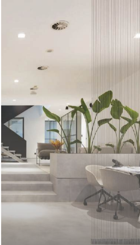
Avenidas Novas, Lisboa RE/MAX Siimgroup Loft