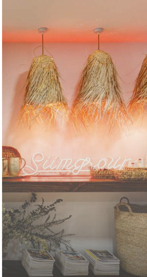
Chiado, Lisboa RE/MAX Collection Siimgroup