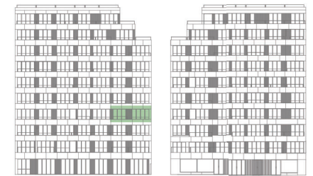
ALÇADO TARDOZ | ALÇADO PRINCIPAL