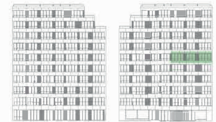
ALÇADO TARDOZ | ALÇADO PRINCIPAL