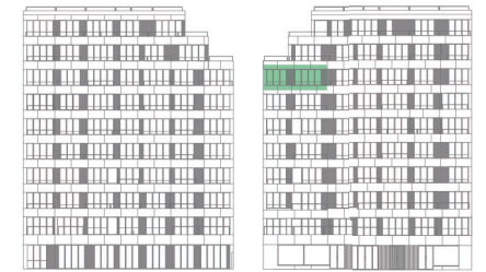
ALÇADO TARDOZ | ALÇADO PRINCIPAL