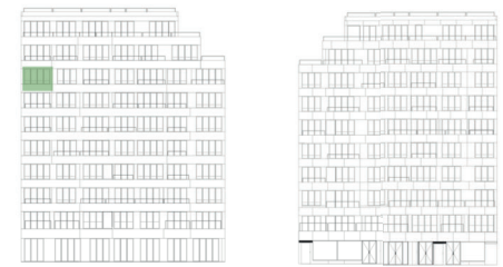
ALÇADO TARDOZ ALÇADO PRINCIPAL