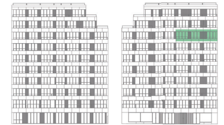
ALÇADO TARDOZ ALÇADO PRINCIPAL