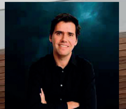
César Frías Enciso - MORPH ESTUDIO

Defendemos a arquitetura como agente transformador, capaz de dinamizar e enriquecer a sociedade. Um ponto de vista que nos leva a partilhar o interesse e entusiasmo em cada um dos nossos projetos, porque queremos que as nossas obras falem por nós.