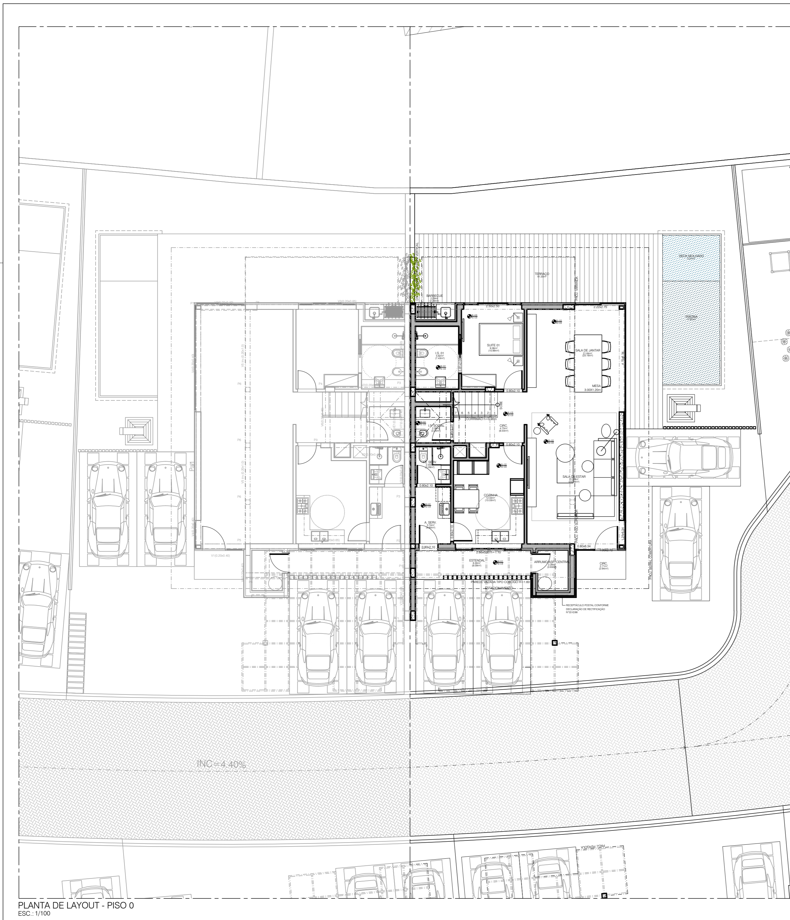
PLANTA DE LAYOUT - PISO 0 ESC.: 1/100