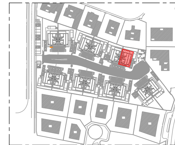
PLANTA DE LOCALIZAÇÃO ESC.: 1/2000

OBSERVAÇÕES / CONVENÇÕES É INDISPENSÁVEL A CONFERÊNCIA DAS MEDIDAS NO LOCAL