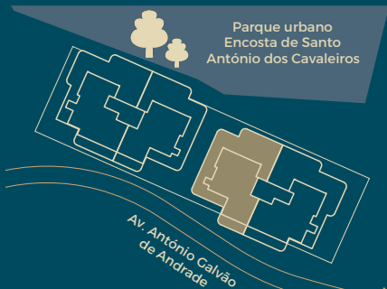
Implantação Master Plan