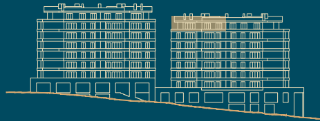
Alçado Sul South facade