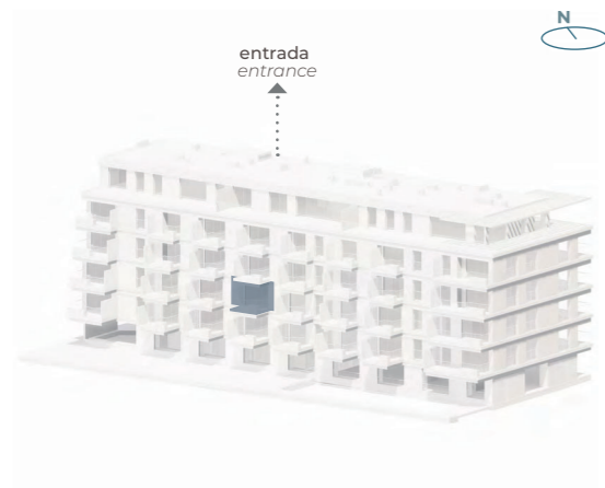
SO - Tardoz SW - Back View