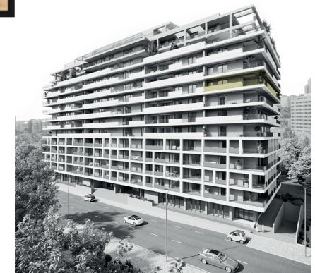
Parque Florestal de Monsanto