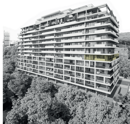
Parque Florestal de Monsanto