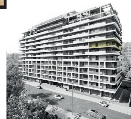
Parque Florestal de Monsanto