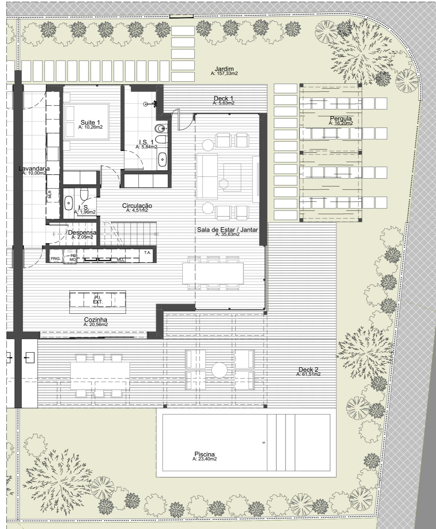
PLANTA - PISO 0 1:100